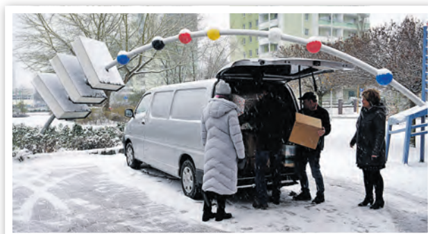
Bei Schnee wurden die letzten Geschenke in die Transporter gepackt, bevor es auf die Reise ging.

individuell Weihnachtspäckchen für die Jungen und Mädchen des rumänischen Heimes. Zahlreiche Schwedter Unternehmen und Institutionen und nicht