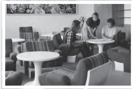
Klubräume wurden mit Möbeln aus der PUR-Möbel-Serie ausgestattet.

Wenn die Schwedterinnen und Schwedter an die PUR-Möbellinie denken, dann fällt immer ein Name: Siegfried Mehl. Der Bauingenieur studierte an der Hochschule für industrielle Formgestaltung Burg Giebichenstein in