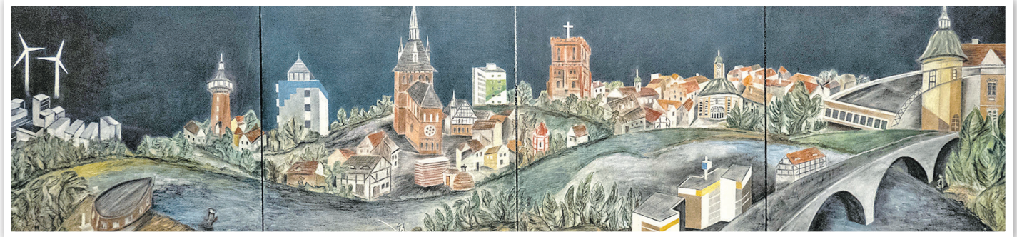
Panorama „Mein Schwedt“

AUSSTELLUNG VOM 27. SEPTEMBER BIS ZUM 27. OKTOBER