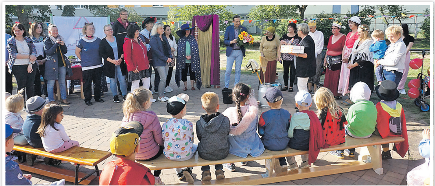
Herzlichen Glückwunsch zum Jubiläum der Kindertagesstätte „Hans Christian Andersen“. Bereits seit 1982, somit seit 40 Jahren, betreut die Kita Kindergarten- und Hortkinder.

40 JAHRE KITA „HANS CHRISTIAN ANDERSEN“ WURDEN ORDENTLICH GEFEIERT