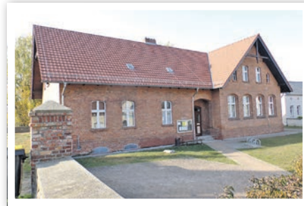
Das Gebäude wurde nach 1900 als Schule mit integrierter Lehrerwohnung errichtet.

Durch die geplante Erweiterung des Gemeindsaals und der Küche werden umfangreiche Abbruchleistungen erforderlich. Dabei ist mit technologisch bedingten Staub- und Lärmbelastigungen zu rechnen. Die Sicherung der