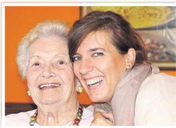
Menschen mit Demenz brauchen Begleitung.

Die Schwedter Kontakt- und Beratungsstelle für Demenzkranke und ihre Angehörigen arbeitet trägerübergreifend und ist im Netzwerk Demenz mit Sozialstationen, Ärzten, Heimen und anderen sozialen Diensten verbunden. Die Leiterin verfügt über vielseitige und fundierte Erfahrungen im Umgang und bei der Arbeit mit Erkrankten sowie bei der Beratung Betroffener und deren Angehörigen. Unterstützt wird sie durch hauptamtliche Mitarbeiterinnen und Mitarbeiter