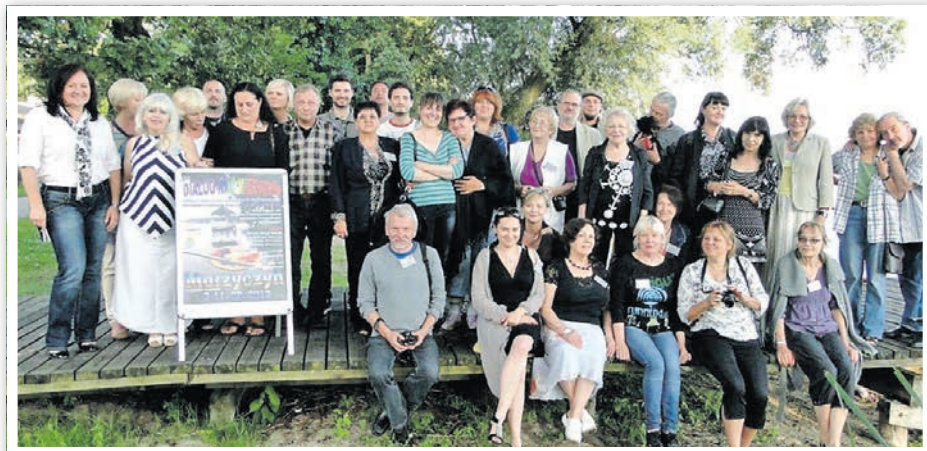
Internationale Künstlervereinigung SAIE