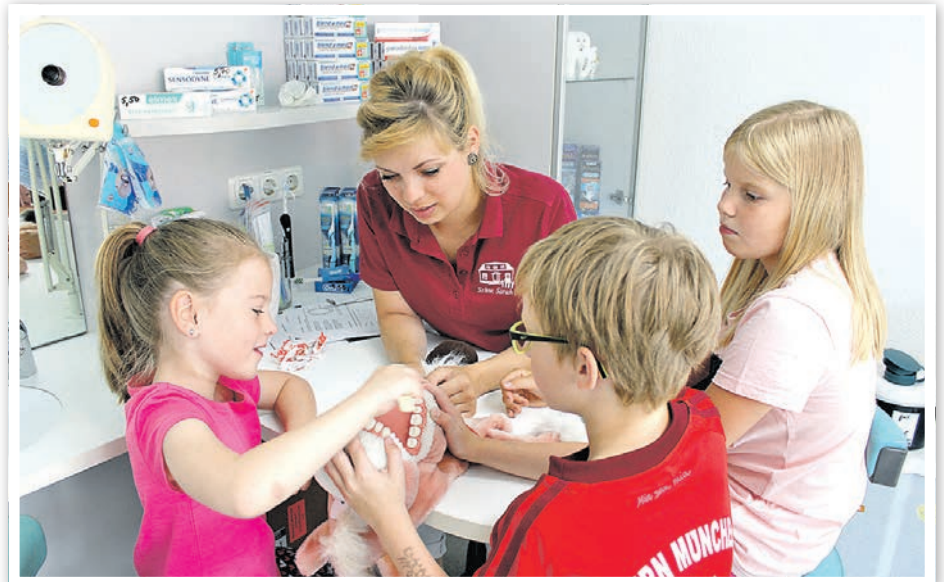
Was macht eine Zahnarzthelferin?

» Uns geht es wahrscheinlich genau wie den Schülern: Sie sehnen sich zurück nach den Sommerferien. Seit einigen Tagen gehen sie nun zur Schule und konnten sich bereits über ihre spannenden Sommerferien unterhalten – aber vor allem über das Agenda-Diplom.