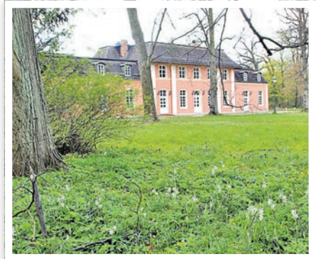
Park Monplaisir im Frühjahr 2015

» Am Mittwoch, dem 4. September, um 17 Uhr lädt Bürgermeister Jürgen Polzehl in den großen Saal des ehemaligen Lustschlosses Monplaisir ein.