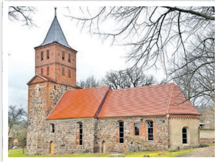
Die Dorfkirche in Rogäsen im Februar 2016 nach Wiederaufbau, 2016.

Das Spektrum der ausgezeichneten Objekte reicht von der mittelalterlichen Dorfkirche Rogäsen bis zum Baudenkmal aus der ersten Hälfte des 20. Jahrhunderts (Bundesschule Bernau). In beeindruckender Weise zeigt die Ausstellung die Vielfalt der brandenburgischen Denkmallandschaft auf, die zur Zeit der sogenannten Wende 1989/90 weitgehend einen mehr als besorgniserregenden Zustand aufwies. Da in den 40 Jahren sozialistischer Planwirtschaft in vielen Fällen jedoch sogar das Geld für den Abriss beschädigter Bauwerke fehlte, bot sich die einmalige Gelegenheit, die zerfallenen Altstädte, aber auch zahlreiche historische Gebäude im ländlichen Raum zu retten, instand zu setzen und teils einer neuen Nutzung zuzuführen. Dazu war und ist ein funktionierendes Netzwerk nötig, dessen verschiedene Glieder durch den jährlich vergebenen Denkmalpreis und nicht zuletzt durch die vorliegende Publikation eine verdiente Würdigung erhalten.