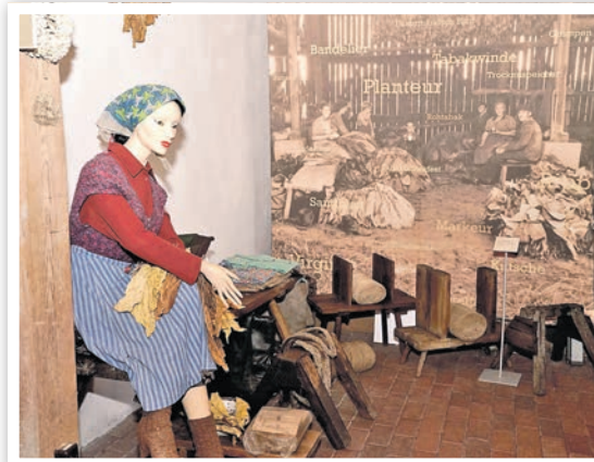
Ausstellung im Tabakmuseum

» Am Sonntag, dem 8. September, ist Tag des offenen Denkmals. Auch das Tabakmuseum Vierraden beteiligt sich und öffnet Haus und Gelände von 10 bis 17 Uhr für alle Besucher. Im Mittelpunkt des Internationalen Denkmaltages stehen Denkmalschutz und Denkmalpflege sowie die Anstrengungen, die für den Erhalt des kulturellen Erbes geleistet werden.