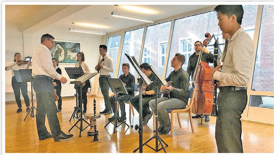
Klezmer-Ensemble der Musikschule Leverkusen

Stadtmuseum Schwedt/Oder, Judenstraße 17 21. September 2019, 19:00 Uhr Der Eintritt ist frei! www.schwedt.eu/stadtmuseum