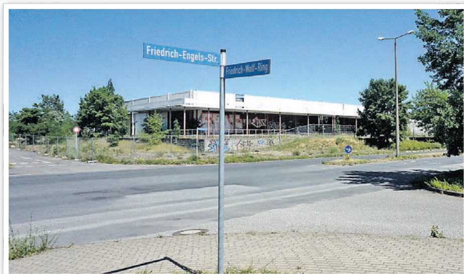
Die ehemalige Kaufhalle steht seit über 10 Jahren leer.

Fachbereich 4: Hoch- und Tiefbau, Stadt- und Ortsteilpflege Alte Fabrik ☎ 03332 446-353 www.schwedt.eu