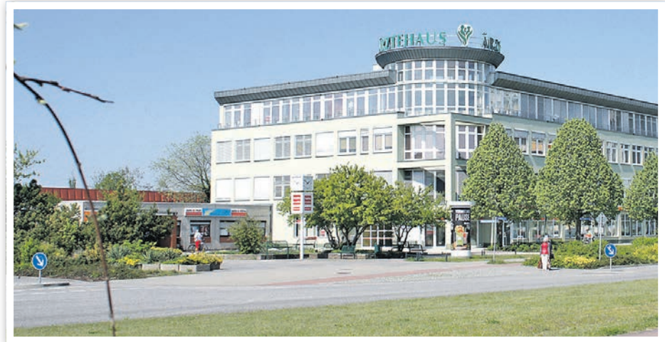
Der Platz vor dem Ärztehaus wird saniert.

Der Bertolt-Brecht-Platz kann über die Feuerwehrezufahrt von der Leverkusener Straße aus befahren werden. Dazu wird zwischen dem Rad- und Gehweg der Grünstreifen unterbrochen und ausgepflastert. Die Uhr und die Litfaßsäule bleiben erhalten. Am Giebel des Geschäftshauses werden die Fahrradständer durch Bügel ersetzt. Da die derzeitige Platzfläche für die tatsächlichen Verkehrs-