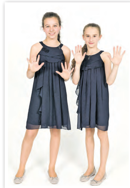
Das Piano Duo „Twenty Fingers“.