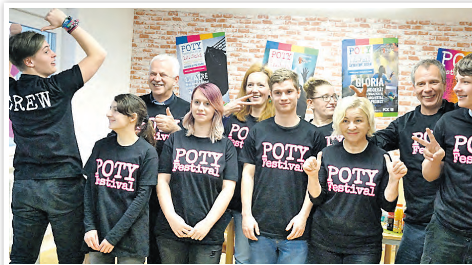
Auch die AG POTY wurde ins Leben gerufen.

Weitere Bands werden in den kommenden Wochen folgen. Das POTY-Organisationsteam hat viel Arbeit vor sich und freut sich über finanzielle wie auch ideelle Unterstützung.