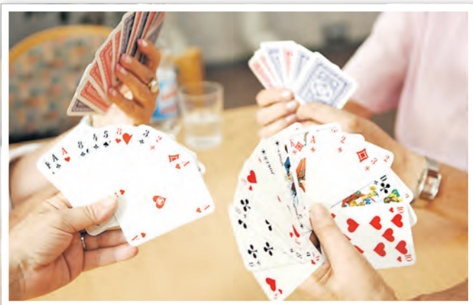
Das MGH lädt alle Senioren zu verschiedenen Aktivitäten ein.

MehrGenerationenHaus, Bahnhofstraße 11b, 16303 Schwedt/Oder ☎ 03332 835040 ✉ mgh-schwedt@volkssolidaritaet.de www.mgh-schwedt.de www.facebook.com/MGHSchwedt