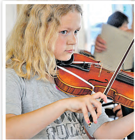
Schülerin der Streicherklasse an der Grundschule „A. Lindgren“ in Schwedt.

Musik- und Kunstschule Schwedt/Oder Berliner Straße 56 ☎ 03332 266311 ✉ musikschule.stadt@schwedt.de www.musikschule-schwedt.de