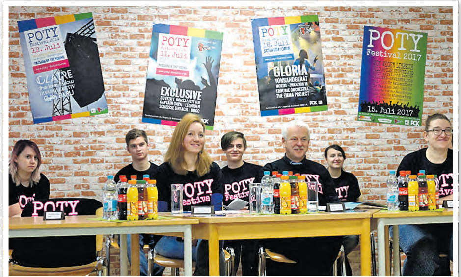
Auf der Pressekonferenz der Festival-Organisatoren und mit dem Bürgermeister wurden die Neuerungen für 2018 vorgestellt.

Um die Zeit bis zum POTY zu verkürzen und die Live-Musik-Szene in der Uckermark zu beleben, werden monatliche Warm up-Partys stattfinden. Am 16. Dezember um 19 Uhr startet die erste Warm up-Party im Schwedter Karthausclub mit den Bands COS (Schwedt) und Uhonja (Templin). Weitere Warm ups in Angermünde, Prenzlau und Templin sind geplant. Ein wichtiger Bestandteil des Projekts POTY ist die Partizipation der Jugend. Dazu wurde die AG POTY ins Leben gerufen. Die schulübergreifende AG trifft sich wö-