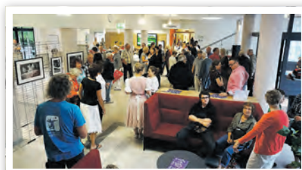
Zahlreiche Besucher im neuen Rathausfoyer am Eröffnungstag

Gleich am Eingang zeigt sich das nun großzügige Foyer mit dem neuen Empfangstresen, Sitzcken und der Rathausgalerie für wechselnde Ausstellungen. Hier findet der Besucher auch den zentralen Markenspender der neuen Aufrufanlage im Haus. Wer sich in den Wartebereich ROT in der 1. Ebene begibt, kommt auf dem Weg dahin am Still- und Wickelraum vorbei. Für unsere kleinen Besucher gibt es eine Kinderspielecke. Hier sorgt auch ein Wasserspender für die nötige Erfrischung an wärmeren Tagen. Zur Verkürzung der Wartezeiten wurde im Rathausfoyer ein WLAN-Hot-Spot eingerichtet, in dem Besucher zwei Stunden kostenlos im Internet surfen können. (öa)