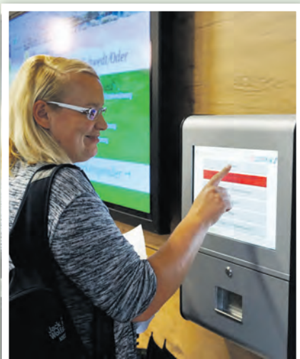
Neben der Information im Foyer befindet sich der Markenspender.

» Am 14. Juli wurde der Markenspender der Meldebehörde durch einen neuen zentralen Markenspender im Foyer ersetzt. An dieser Aufrufanlage sind die Bereiche Kasse, Ausländerbehörde, Meldewesen mit Bürgerberatung, Standesamt, Steuern, Wohngeld und Bundeselterngehalt angeschlossen. Sobald das Anliegen am Markenspender im Foyer gewählt wurde, wird eine Marke gedruckt, die neben der Aufrufnummer den gewählten Bereich und die Ebene des aufzusuchenden Wartebereiches nennt. Die Wartebereiche befinden sich in der 1. (roten) Ebene und in der 2. (gelben) Ebene. Auf den dortigen Bildschirmen wird neben der Aufruf-Nummer der Raum und der Platz angezeigt, der aufzusuchen ist.