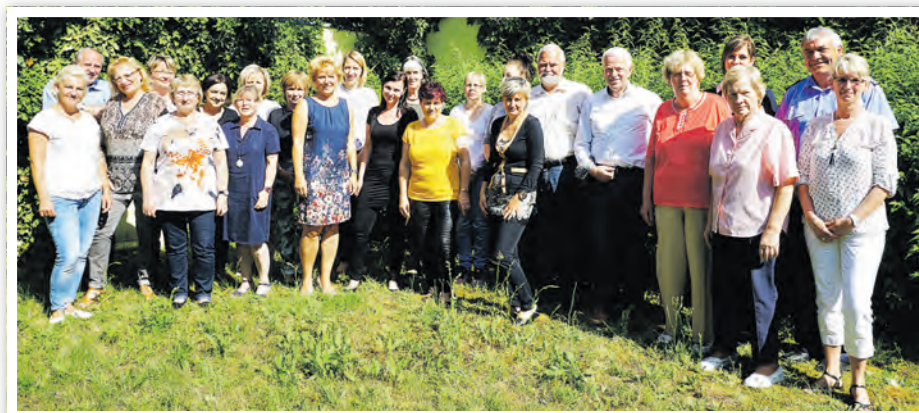
Alle anwesenden Bündnismitglieder versammelten sich bei ihrer letzten Sitzung im Garten der Wohnbauten Schwedt zum gemeinsamen Gruppenfoto

Mittlerweile ist der Zusammenschluss aus Unternehmen, Einrichtungen und