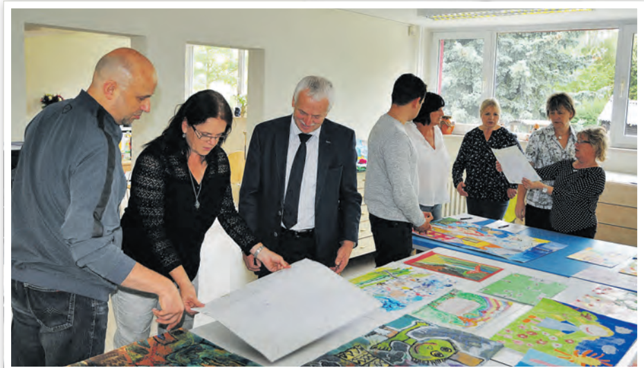
Zuerst erfolgt die Sichtung aller Arbeiten je Altersklasse.