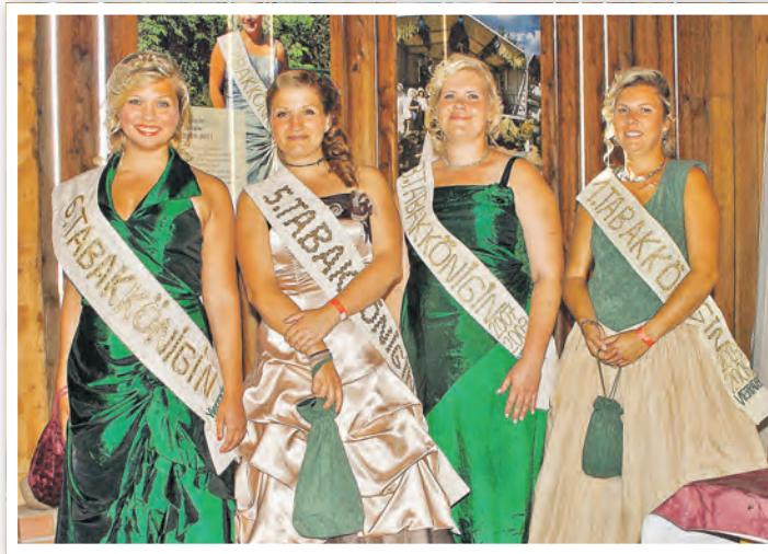
Beim letzten Tabakblütenfest 2015, wo gleichzeitig 750 Jahre Vierraden gefeiert wurde, trafen sich ehemalige und amtierende Tabakköniginnen.

Ab 14:00 Uhr wird auf dem Marktplatz in Vierraden ein buntes Programm