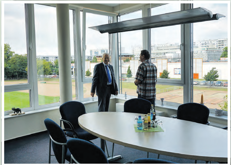
Der Blick aus dem Bürgermeisterbüro.

Der Baubeschluss im Dezember 2013 und die Gewinnung von Fördermitteln aus dem Stadtumbau-Programm (2 Mio. Euro) ebneten den Weg für die letzte Maßnahme zum „Auf- und Ausbau des Bürgerrathauses“. Mit dem Eigenanteil der Stadt von 1,8 Mio. Euro konnte nun das neue, bürgerfreundliche Rathaus vollendet werden. Dazu waren unter anderem 2.800 qm Maurer-, 3.500 qm Putz- und 6.500 qm Malerarbeiten, 3.500 qm Stahl, 2.200 qm Fußbodenbelag und 500 qm Dachdeckung notwendig.