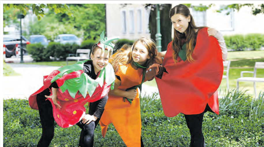
Erdbeere, Möhre und Tomate – Frisches vom Markt

Frischemarkt an. Ab 09:00 Uhr sind Frische-Genießer, Regional-Gourmets und Schleckermäuler auf dem Kirchplatz