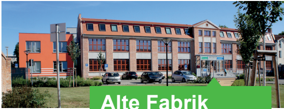
Alte Fabrik Dr.-Th.-Neubauer-Straße 12