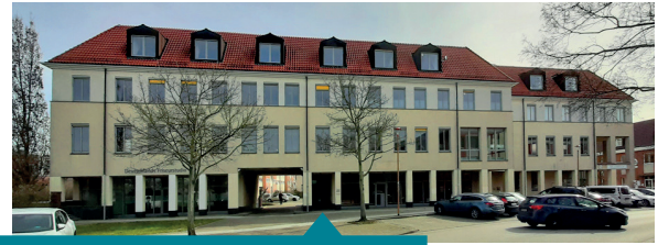
Außenstelle Dr.-Th.-Neubauer-Straße 24

Hochbau (Fachbereich 8) 301–306, 309–312