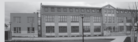
Alte Fabrik , Dr.-Th.-Neubauer-Straße 12