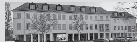
Außenstelle , Dr.-Th.-Neubauer-Straße 24