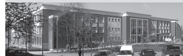
Rathaus , Dr.-Theodor-Neubauer-Straße 5