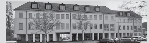
Außenstelle , Dr.-Th.-Neubauer-Straße 24