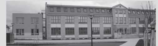
Alte Fabrik , Dr.-Th.-Neubauer-Straße 12