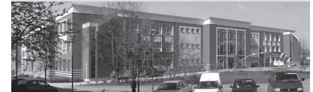
Rathaus , Dr.-Theodor-Neubauer-Straße 5